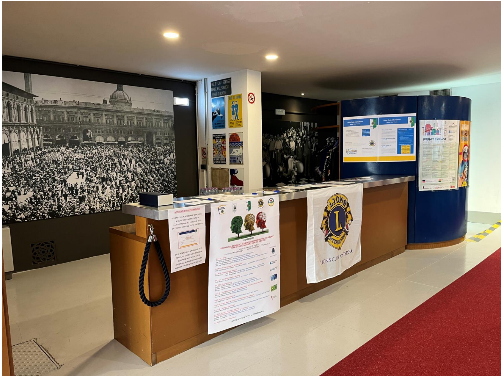
Lions Club Pontedera Desk di ingresso